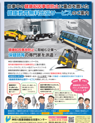
健康教育無料出張サービスのご案内