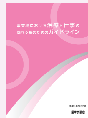
両立支援のためのガイドライン

専門家が事業場を訪問し、治療と仕事の両立支援に関する制度導入の支援や管理監督者、社員等を対象とした意識啓発を図る教育を実施します。患者（労働者）に係る健康管理について、事業者と患者（労働者）の間の仕事と治療の両立に関する調整支援を行い、両立支援プラン・職場復帰支援プランの作成を助言、支援します。