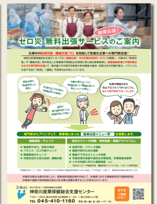
ゼロ災無料出張サービスのご案内