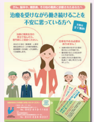
両立支援のためのポスターとカード