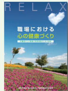
職場における心の健康づくり

メンタルヘルス対策に精通した専門スタッフが中小規模事業場に赴き、職場のメンタルヘルス対策推進のための支援を行います。また、管理監督者・若年者を対象としたメンタルヘルス教育も実施します。